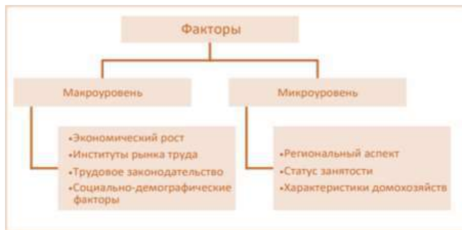
Рис. 3 Факторы, влияющие на «экономическую бедность

оказывают влияние только на заработок отдельных работников, а факторы на уровне домохозяйства – на трудовое участие и нагрузку на домохозяйство (рис. 8).