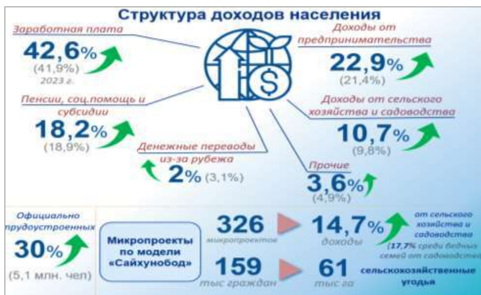
Рис.2 Структура доходов населения в Узбекистане

Доходы от предпринимательской деятельности также показали положительную динамику, увеличившись на 1,5% до 22,9%. В то же время доходы от сельского хозяйства и приусадебных участков выросли на 0,9%, достигнув 10,7%, тогда как доходы от денежных переводов сократились до 2,0%. Реальные доходы населения увеличились на 10,7%, что соответствует среднему доходу на душу населения в размере 2,1 миллиона сумов в месяц. Заработная плата, как один из главных факторов, способствующих улучшению уровня жизни граждан, составила 42,6% от общего объема доходов [2].