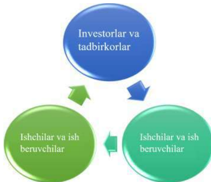
2-rasm. Kichik biznesda raqamli platforma tuzilishi

Investorlar, ishchilar va tadbirkorlarni o‘zaro bog‘lashga qaratilgan loyiha raqamli platformalar kichik biznes subyektlari uchun qanday imkoniyatlar yaratishini yaqqol ko‘rsatadi. Bunday platformalar kichik korxonalariga zarur resurslardan foydalanish, yangi bozorlarga kirish va ish jarayonlarini yanada samarali tashkil etishda yordam beradi. Ushbu innovatsion raqamli platforma turli manfaatdor tomonlarni birlashtiruvchi virtual ekotizimni shakllantirib, ularning o‘zaro hamkorligini samarali yo‘lga qo‘yadi.