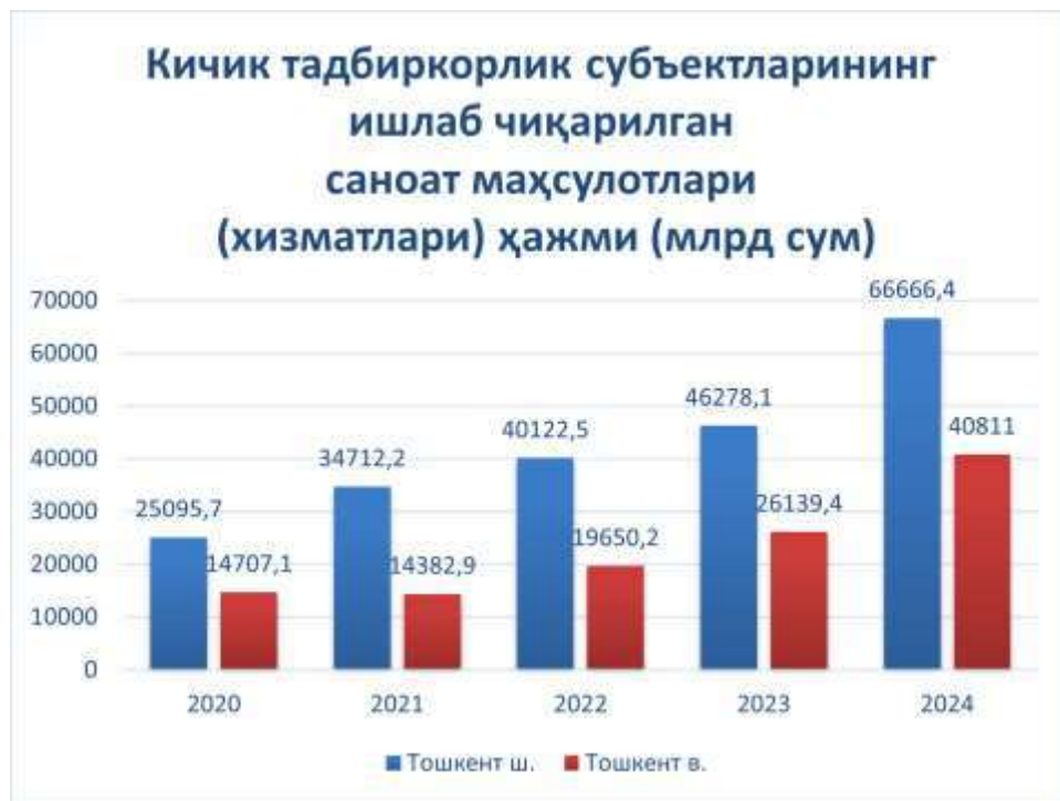
2-rasm. Kichik tadbirkorlik subyektlarining ishlab chiqarilgan sanoat mahsulotlari (xizmatlari) hajmi (mlrd.sum) [7]

Taqdim etilgan rasmdagi ma’lumotlar Toshkent shahri va Toshkent viloyatida kichik tadbirkorlik subyektlarining sanoat salohiyati so’nggi besh yil ichida strategik jihatdan yuksalganligini yaqqol namoyon etadi. 2020 yildan 2024 yilgacha bo’lgan davr ichida ishlab chiqarish hajmining qariyb uch baravarga yaqinlashishi nafaqat miqdoriy o’sishni, balki hududiy iqtisodiyotning sifat jihatidan yangi bosqichga chiqqanini anglatadi. Xususan, 2020 yildagi global iqtisodiy cheklovlar davridagi ko’rsatkichlar (shaharda 25,1 va viloyatda 14,6 mlrd so’m) poydevor vazifasini bajargan bo’lsa, keyingi yillardagi keskin o’sish sur’atlari ichki bozorda kichik biznesga bo’lgan ishonchning mustahkamlanganidan dalolat beradi.