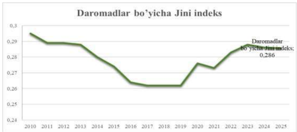
1-rasm. Daromadlar tengsizligi dinamikasi 39

Biroq 2021-yildan boshlab daromadlar tengsizligi yana ortish tendensiyasini namoyon etmoqda. 2021-yilda indeks 0,276, 2022-yilda 0,273, 2023-yilda 0,283, 2024-yilda esa 0,288ga yetgan. 2025-yilda esa mazkur ko'rsatkich 0,286ni tashkil etgan.