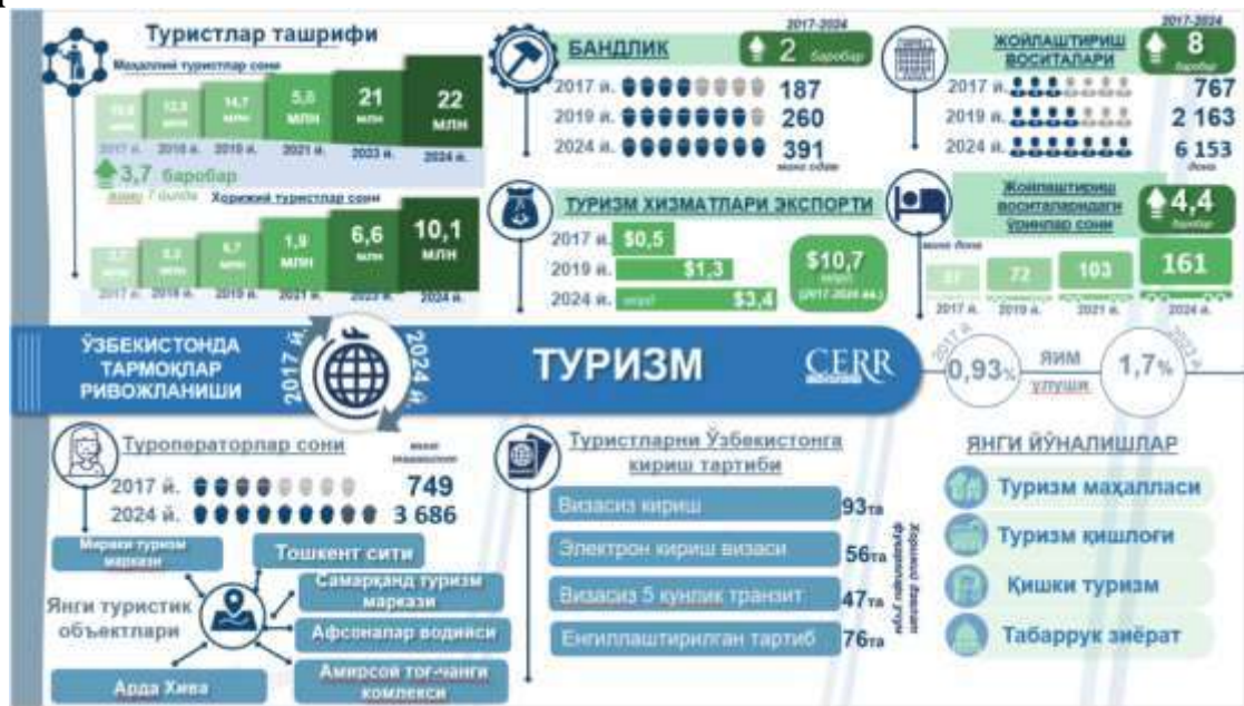
3-rasm Turizm tarmoqlari rivojlanishi

3. Kam byudjetli turlar va ijtimoiy dasturlarni tashkil etish. Mavsumlar oralig‘ida infratuzilma bandligini saqlab qolish uchun kam xarajatli va ijtimoiy turlarni rivojlantirish zarur. Bular dam olish kunlari uchun ekskursiyalar, ma‘rifiy sayohatlar, etnografik yo‘nalishlar, gastronomik festivallar, maktab va korporativ dasturlar bo‘lishi mumkin.