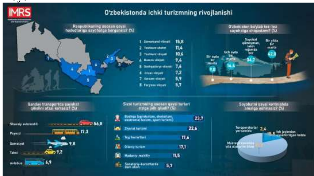
1-rasm. O'zbekistondagi ichki turizmning rivojlanishi

Ichki zaxiralardan foydalanishning nazariy-uslubiy asoslari quyidagicha. Turizm faoliyatini boshqarishda ichki zaxiralar deganda, ichki resurslar va salohiyatlar majmui tushuniladi. Ulardan foydalanish katta hajmdagi tashqi sarmoyalarni talab qilmaydi, biroq soha faoliyati samaradorligining o'sishini ta'minlaydi.