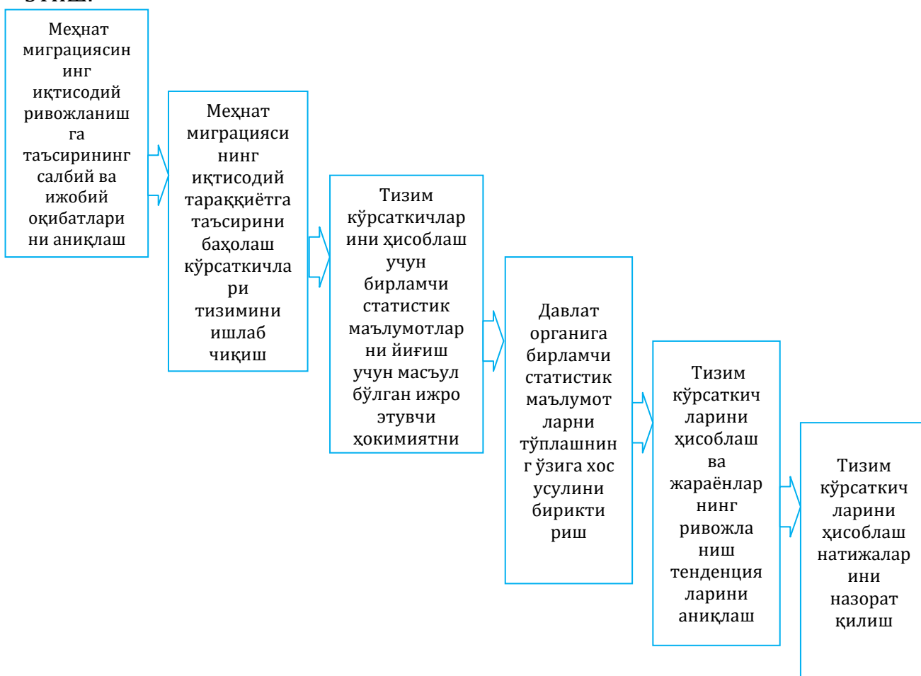
3-расм. Меҳнат миграциясининг иқтисодий ривожланишга таъсирини ўрганишга услубий ёндашув босқичлари.

Олтинчи босқич - аҳолини рўйхатга олиш маълумотлари асосида рўйхатга олиш даврида олинган таҳлилий маълумотларнинг алоҳида кўрсаткичларини ҳисоблаш натижаларини назорат қилишни ташкил этиш.