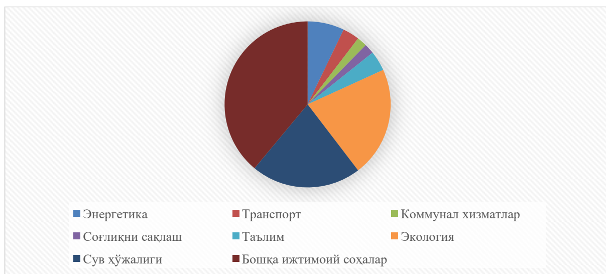
1-расм. Соҳалар кесимида давлат-хусусий шериклик лойиҳалари сони

Ўзбекистон Республикаси Президентининг 2022 йил 28 январдаги “2022-2026 йилларга мўлжалланган Янги Ўзбекистоннинг тараққиёт стратегияси тўғрисида” ги ПФ-60-сон Фармони 2-илоvasи билан тасдиқланган Давлат дастурининг 105-бандига мувофиқ, давлат-хусусий шериклик асосида энергетика, транспорт, соғлиқни сақлаш, таълим, экология, коммунал хизматлар, сув хўжалиги ва бошқа соҳаларга қиймати қарийб 14 млрд.доллардан иборат бўлган 154 та давлат-хусусий шериклик лойиҳаларни амалга ошириш белгиланган [1]