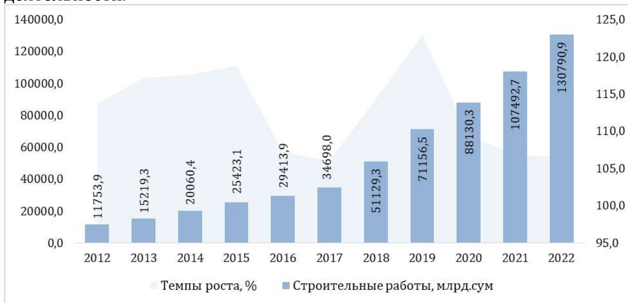
Рис. 2. Динамика роста строительных работ по Узбекистану

Статистические данные позволяют нам рассмотреть, как менялась динамика строительных работ по Республике Узбекистан, на рисунке 2 видно, что за последние 10 лет произошел значительный рост, а это в свою очередь свидетельствует об активизации строительной деятельности.