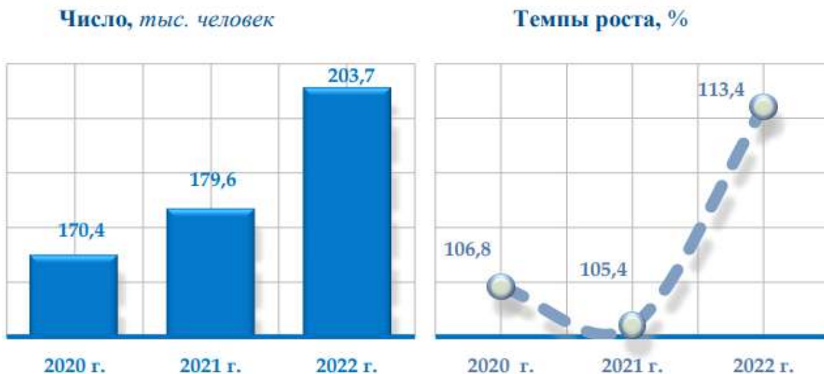
Рис 1. Число зарегистрированных рождений 2020–2022 годы

В январе-марте 2022 года было зарегистрировано 203,7 тыс. родившихся детей, соответственно коэффициент рождаемости на 1000 населения составил 23,4 промилле и, по сравнению с аналогичным периодом 2021 года, увеличился на 2,4 промилле (за 2021 год - 21,0 промилле)