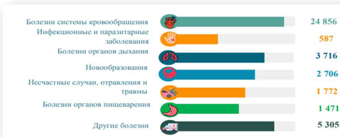
Рис 2. Основные причины смерти населения январь-март 2022 года