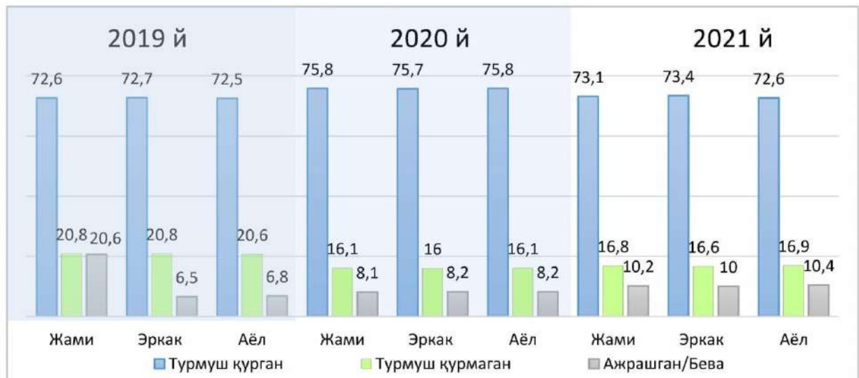
1.-расм. Меҳнат мигрантлари оилаларидаги ажримлар динамикаси, %.

Тадқиқотимиз натижалари меҳнат миграциясининг гендер хусусиятини ўзгараётганлигини кўрсатмоқда. Аёлларнинг биринчи навбатдаги ўрни оилададир. Уларнинг узоқ муддат уйларида бўлмаслиги фарзандлар тарбиясига ҳам салбий таъсир кўрсатмоқда. Ҳорижга бориб ишлаш учун албатта вақтинча бўлса ҳам рўйхатдан ўтилади. Айрим ҳолатларда бундай вазиятларда эркаклар томонидан фиктив - “сохта” никоҳ қуриш ҳолатлари ҳам кузатилади. Ўз-ўзидан ўзга юртларда бундай никоҳларнинг юзага келиши нафақат оиласига пул жўнатмаларини пасайишига ёки умуман тўхтаб қолишига, шу билан бирга, оилавий ажримларнинг ҳам ўсишига олиб келади.