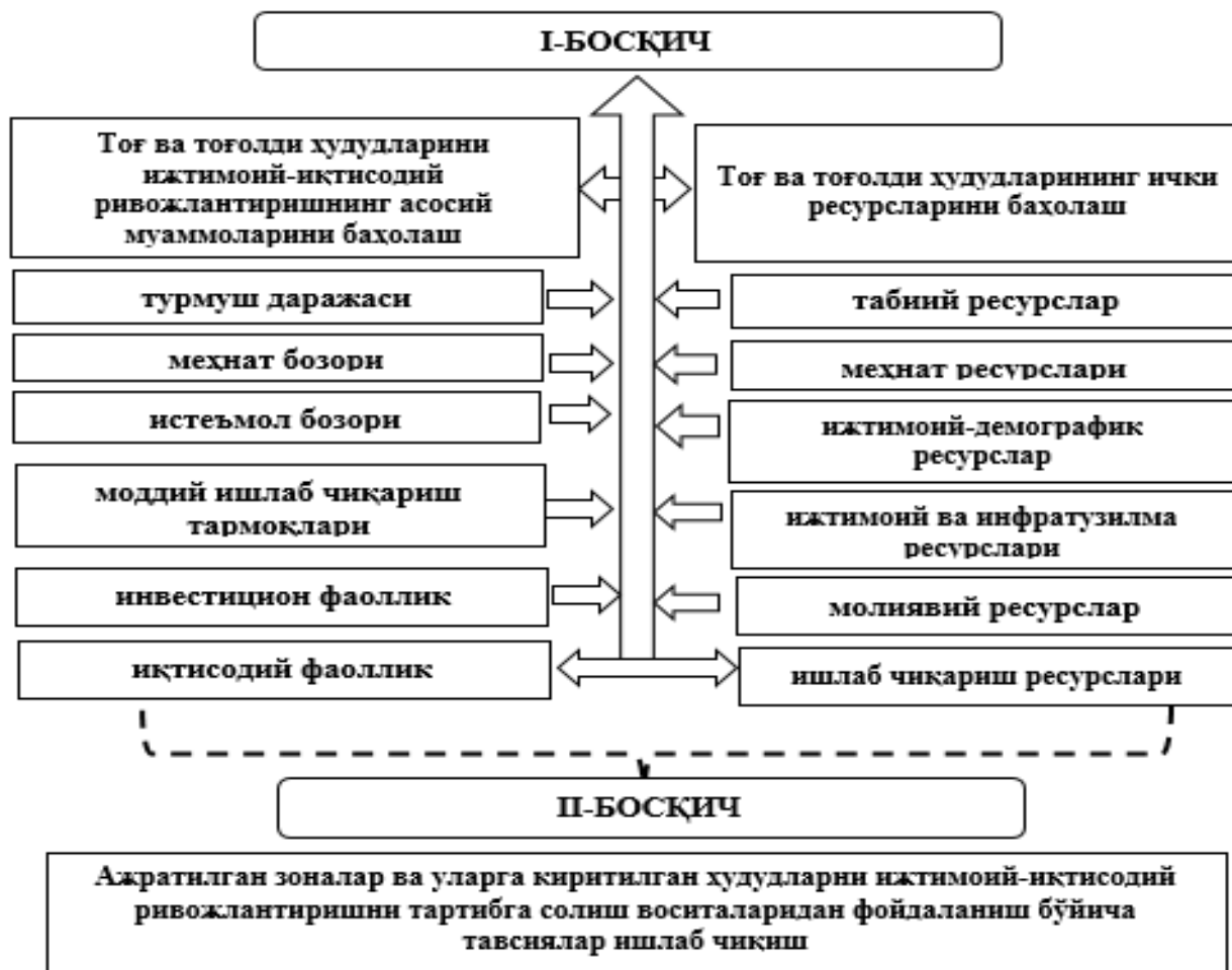
2-расм. Тоғ ва тоғолди хуудларини минтақалаштиришда муаммоли-ресурс ёндашуви алгоритми 111

миқдордаги улуши маҳаллий бюджет даромадлари (молиявий ресурслар), асосий воситалар мавжудлиги (ишлаб чиқариш ресурслари).