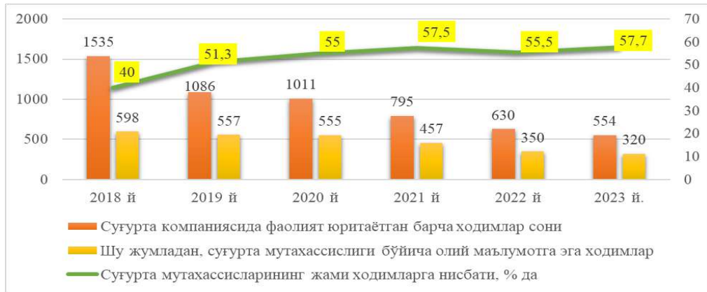
1-расм. “Ўзагросуғурта” АЖ да ходимлар таъминоти ва суғурта мутахассислари билан таъминланганлик даражаси 15

“Ўзагросуғурта” АЖ ходимларнинг 60 фоизга яқини олий маълумотли, хусусан 26 фоизи молия, иқтисод ва суғурта соҳаси мутахассисларидир. Тизимда раҳбарлик лавозида фаолият юритаётганларнинг 30 фоизи ёшлар ҳисобланади.