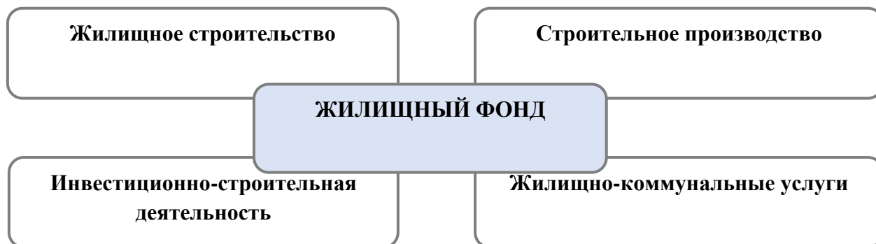
Рис. 2. Взаимосвязь жилищного фонда с различными сферами

При представлении жилищного фонда как системы то она является связующей с различными сферами деятельности, в числе которых инвестиционно-строительная деятельность, сфера жилищного строительства и строительного производства, сфера жилищно-коммунальных. Таким образом, для развития жилищного фонда необходимо параллельно развивать сферы, показанные на рисунке 2.