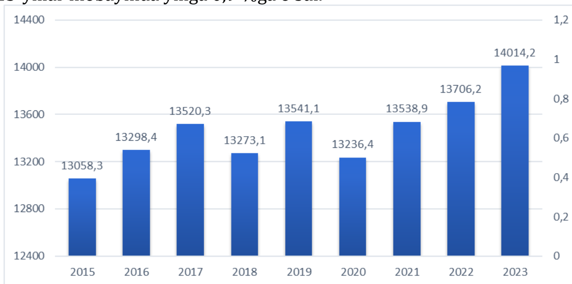
1-rasm. Iqtisodiyotda bandlarning o'rtacha yillik soni (ming)

So'ngi yillarda aholi bandligini oshirishga qaratilgan amaliy chora-tadbirlarni samarali ijro etilishi natijasida aholi bandligi muttasil oshib bordi. Xususan, 2015- yilda iqtisodiyotdagi bandlar soni 13,1 million kishini tashkil etgan bo'lsa, bu ko'rsatkich 2023-yilga kelib 14,0 million kishidan oshib ketdi yoki 6,9 %ga ko'paydi (1-rasm). Iqtisodiyotdagi o'rtacha bandlar soni 2015-2023-yillar mobaynida yiliga 0,9 %ga o'sdi.