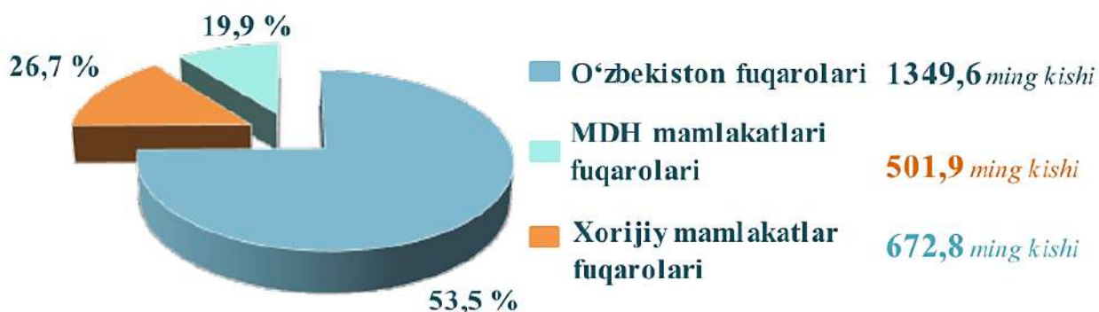
3-rasm. Joylashtirilgan shaxslar soni

2023- yil davomida mehmonxonalar va shunga o'xshash joylashtirish muassasalarga 2524,3 ming kishi joylashtirildi, ulardan 53,5 %i O'zbekiston fuqarolari, 19,9 %i MDH ga a'zo davlatlar fuqarolari va 26,7 % i xorijiy davlatlar fuqarolari bo'ldi.