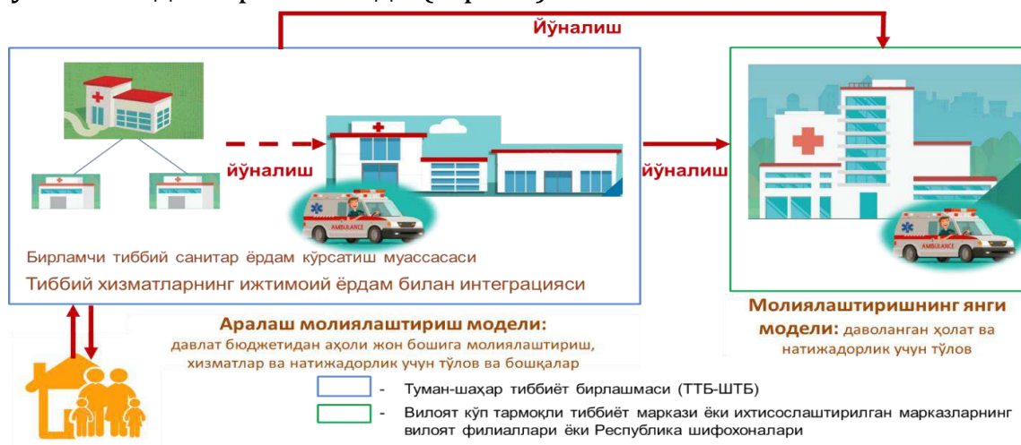
2-расм. Молиялаштириш янги тизими шароитида бемор ҳаракатланиш режаси таҳлили 16

Давлат тиббий суғуртаси механизмлари самарадорлигини ошириш, бирламчи тиббиёт муассасаларида оилавий шифокорлар ёки тиббиёт бригадалари томонидан аҳолига тиббий ёрдамнинг кафолатланган ҳажмига кирадиган хизматларнинг бепул ва сифатли кўрсатилишига зарур шарт-шароитлар яратиш мақсадида суғурта орқали молиялаштириш тартиби жорий этилмоқда. Мазкур тартиб ва давлат тиббий суғуртаси тизимидан фойдаланиш 2024 йил 1 октябрдан бошлаб Тошкент шаҳри ва Сирдарё вилоятида, 2025 йил 1 январдан Қорақалпоғистон Республикасида жорий этилди (2-расм).